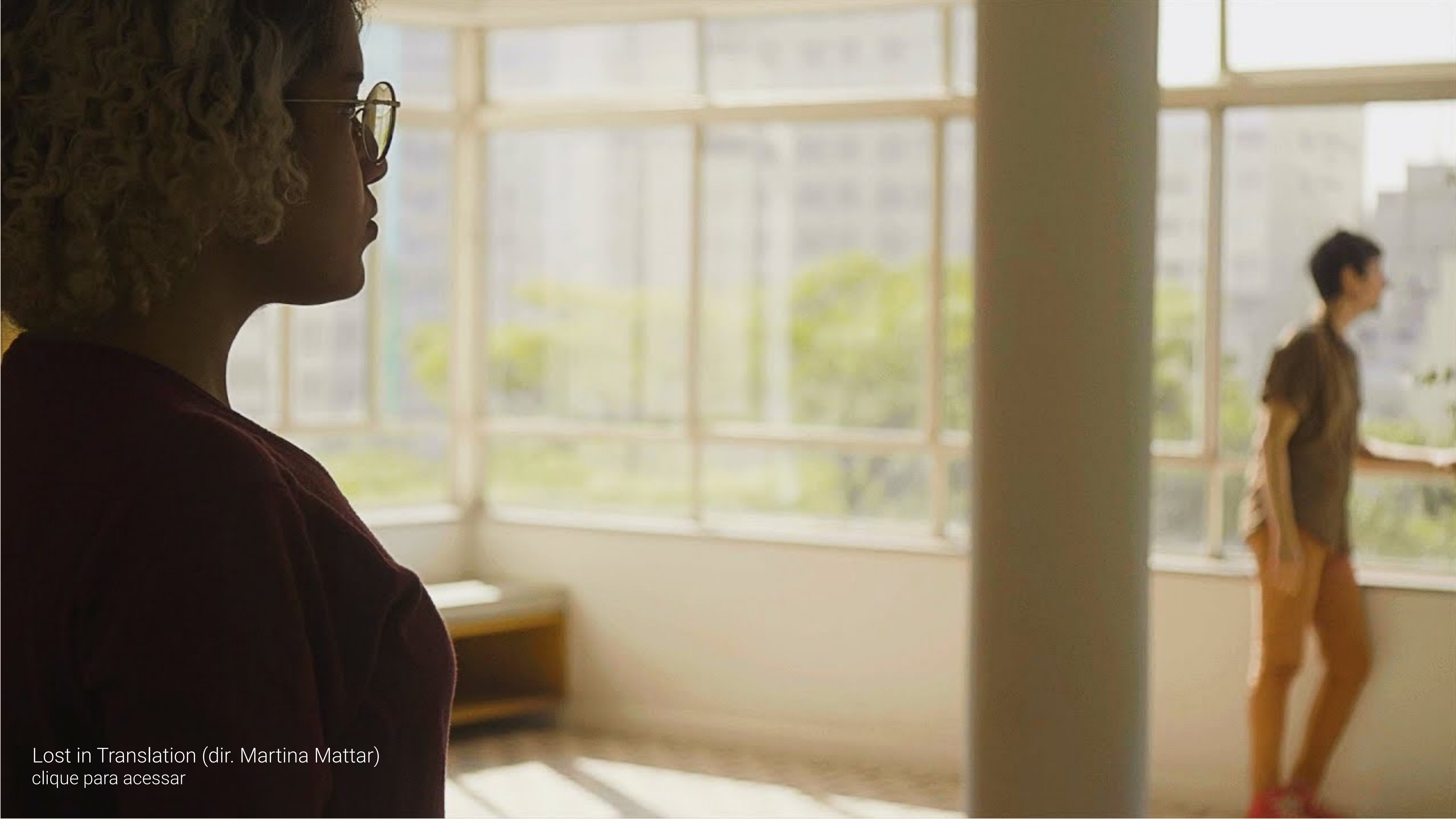
Lost in Translation (dir. Martina Mattar) clique para acessar